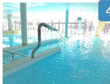
Le col de cygne cible le cou, les épaules et le dos