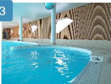
L'alcôve immersive est composée de 4 jets pour vos cuisses et fessiers