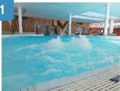
2 jets massants pour vos pieds et vos jambes